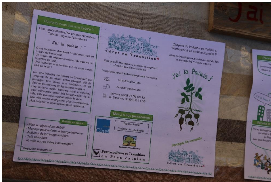
Le flyer de Céret en transition

Cette initiative est le début d'un projet de plus grande ampleur avec notamment la création d'une Association de Maintien de l'Agriculture Paysanne (AMAP), différents projets portés par le collectif Céret en transition.