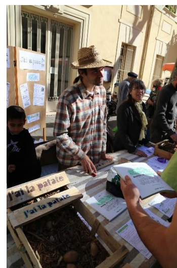
Le stand de distribution

Le repas final sera réalisé avec l'aide d'un chef cuisinier dans une ambiance similaire aux émissions de type Top chef. Le repas sera partagé avec l'ensemble des participants pour un moment convivial.