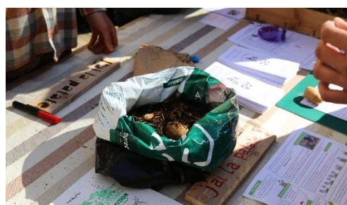
La technique du sac retourné

L'idée de ce projet est de faire du lien entre des personnes autour d'un même objectif : cultiver sa patate. Les participants sont amenés à se rendre compte de la difficulté et des enjeux de faire pousser soi-même ses légumes. Afin de créer du lien entre les habitants, les participants sont mis en contact grâce à une mail-liste commune où ils peuvent communiquer et